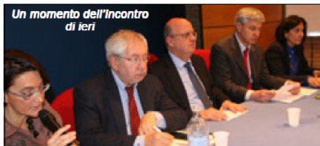
Un momento dell'incontro di ieri

ai siti interessati e ad iscriversi per essere informati sulle iniziative in campo.